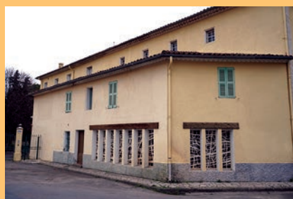
Extérieur de la chapelle avec ses vitraux