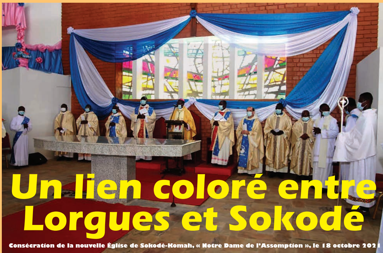
Consécration de la nouvelle Église de Sokodé-Komah, « Notre Dame de l'Assomption », le 18 octobre 2021