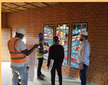
Mise en place dans l'église de Sokodé