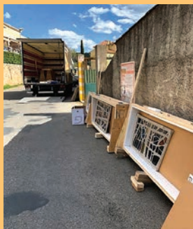
A Lorgues, les vitraux sont soigneusement démontés et emballés